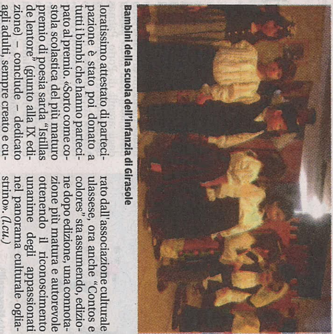
Bambini della scuola dell'infanzia di Girasole

la palma d'oro alla scuola primaria di Ulssai (III e IV) per l'opera, tradotta in sardo, «Marta Mezzomondo» (di Bruno Tognolini), mentre il secondo posto è andato alle primarie (IV A) di Fertema che hanno incantato gli spettatori con un rifacimento in lingua della famosa opera di Colloidi. Cabizosu prosegue: «L'antica pratica de «Sa pregunta», la richiesta ufficiale di matrimonio, ha infundato lo spunto ai bimbi della scuola dell'infanzia di Girasole, che si sono meritatamente aggiudicati il primo premio della sezione a loro dedicata». Un co-