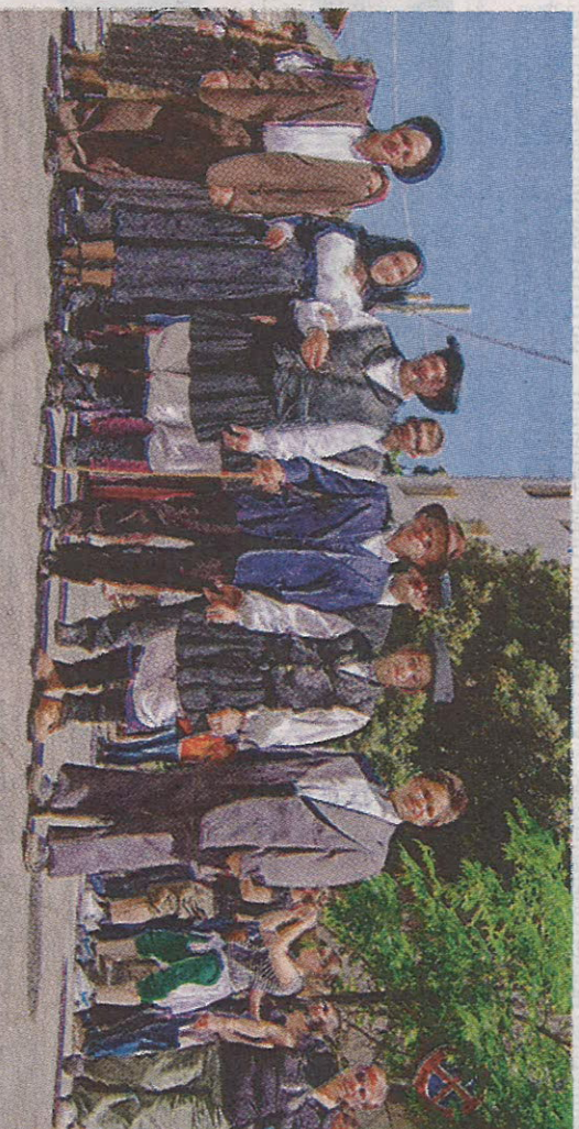
«Sa coua baunesa»

sposi avrà luogo prima «su cumbidu», l'invito, successivamente «sa merenda e sa coua», il pranzo nuziale con la degustazione dei piatti tipici del matri-